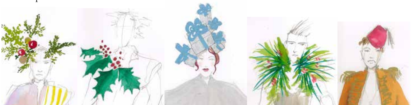
Kostymskisser av Maria Gyllenhof

Judas hänger upp Jesus på ett stängsel, där han blöder och dör. Lärjungarna lyfter ner hans kropp och bär iväg den medan de sjunger, först med sorg men sen alltmer med glädje. Jesus lära och deras kärlek och gemenskap lever vidare.