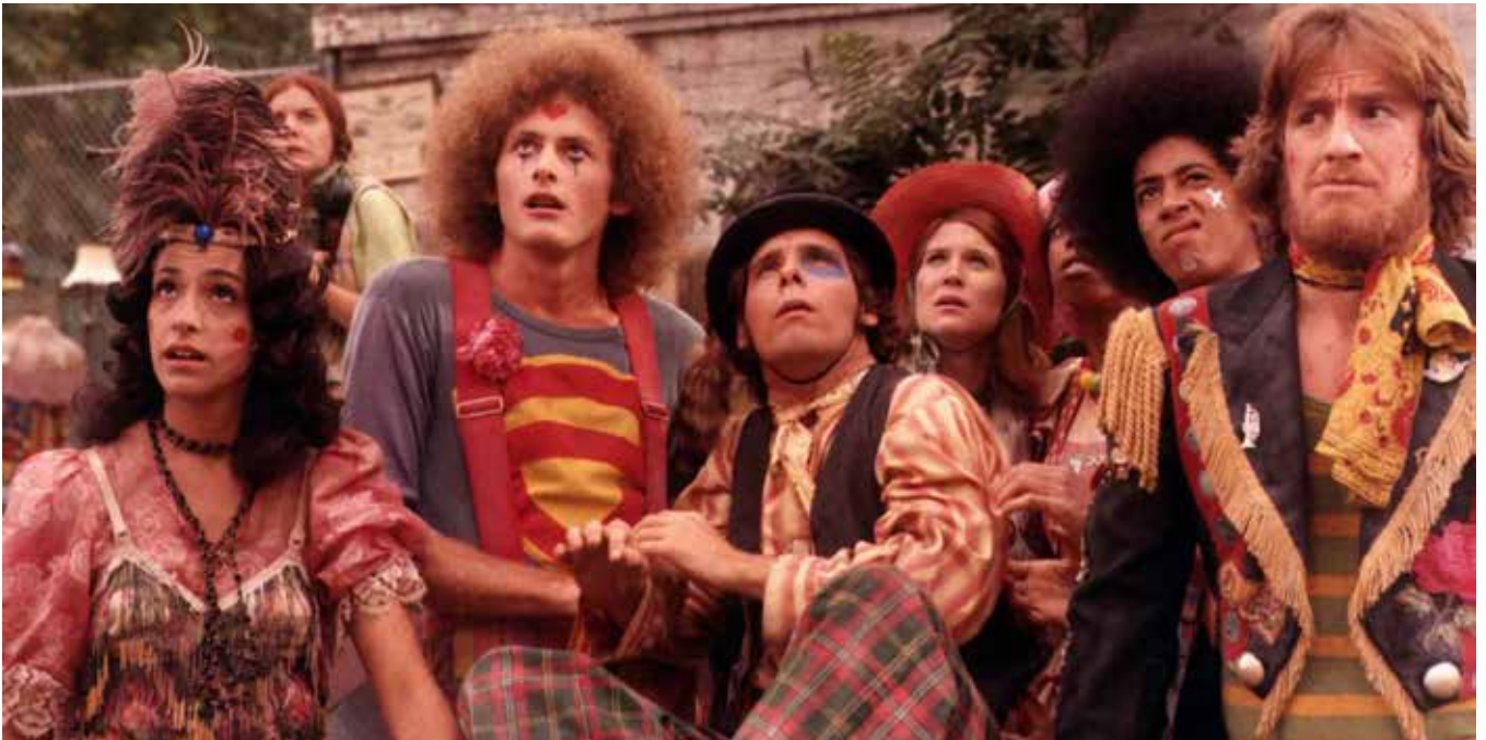
En scen ur filmen Godspell

Godspell's Jesus är långt ifrån den Jesus vi så ofta ser på bilder från kyrkor, på kort, affischer och i böcker. I filmen är lärjungarna liksom Jesus klädda som clowner med randiga byxor, hattar på sned och rosiga kinder. Många har tolkat det som att de är "flower children" eller hippies. Men inspirationen hämtades snarare från de medeltida narrfesterna med sina uppsluppna maskerader, där man vände upp och ner på kyrkans strikta roller och gjorde narr av påvar och biskopar.